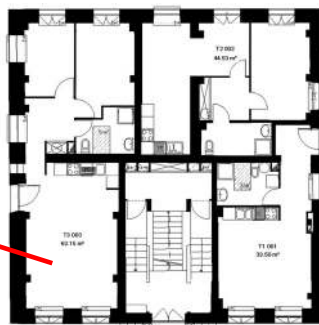
Maison de maître- Plan RDC projet