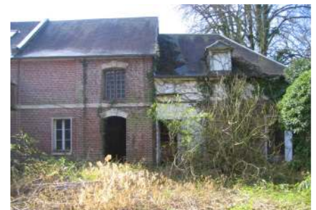
Bâtiment initial d'une des dépendances

Mission: Complète loi MOP - ECONOMISTE Maître d'ouvrage: OPAC DE L'OISE Equipe: Ad Rem Architecture / 2AD Architecture Coût: 3 488 000 € Surface de plancher: 1655m 2 Avancement: Livré